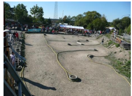
Banan för 1:10 OffRoad

Under hösten har det varit många stora aktiviteter. Förutom alla dagar som folk har kört på banan så har klubben genomfört Löfstadagen, Hobbymässan samt Prova-på-projekt.