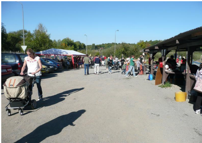
Många besökare kom till klubben på Löfstadagen

Här kommer vårt första månadsbrev. Dessa kommer i fortsättningen komma en gång i månaden. Brevet kommer att innehålla information om vad som händer i klubben, vad som är på gång, rapporter från genomförda aktiviteter, erbjudande från våra sponsorer m.m.