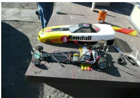
Dragracingbil - el

Som vanligt visades många bilar upp, det var fullt på alla mekbord. Bland annat så kunde man beskåda några dragracingbilar. Dessutom fick man möjlighet att höra hur dessa vassa motorer låter.