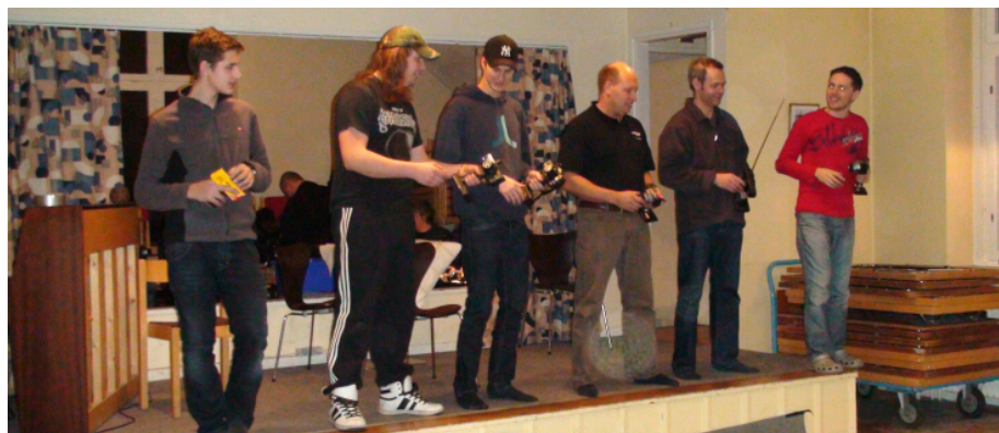
Koncentration på alla kanter

Det har bildats ett "banbyggargäng" som luftar sina idéer på forumet. Alla är välkomna att vara med. Banbyggarna kommer till Skolan vid halv sex, kom Du också.