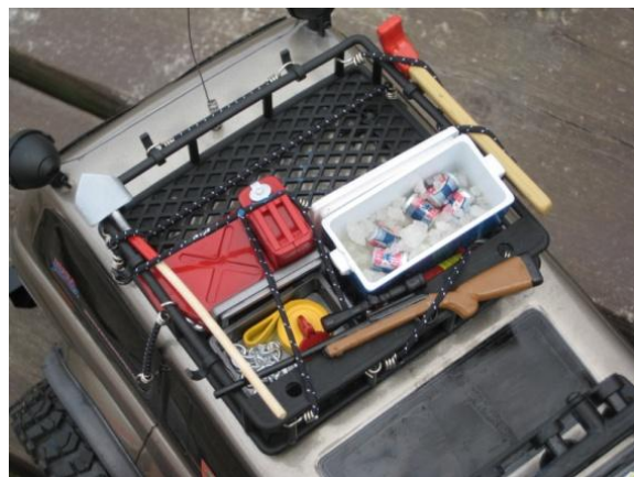
Observera ölen på kylning bland isen

Allt ser enkelt ut när någon som kan det kör, men det är svårare än man tror och en fantastiskt rolig utmaning att köra crawling. I crawling handlar det om att leta fäste och hålla reda på var alla fyra hjulen är på väg så man inte fastnar eller vurpar.