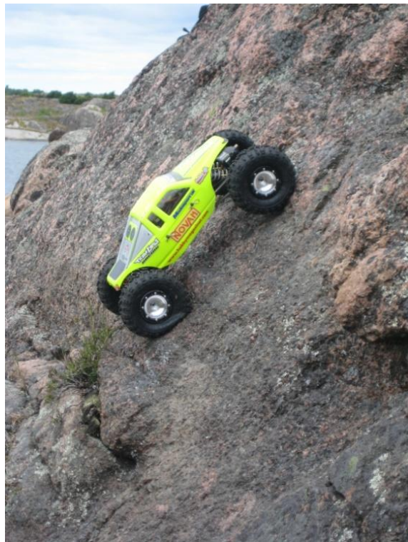
2.2 RockCrawler i bergsbrant, 75 grader lutning!

Crawling skiljer sig väldigt mycket från alla andra discipliner. En av de stora skillnaderna är att det inte är en hastighetssport, utan en teknikgren. Crawlerbilarna går inte särskilt fort, som max promenadfart, men de är oerhört starka och har mycket vridmoment. De har fyrhjulsdrift och ofta 4-hjulsstyrning, eller DIG som alternativ. DIG-funktionen innebär att man kan låsa bakre (på vissa modeller även främre) axeln vilket gör att framhjulen kan släpa runt bilen med en väldigt liten svängradie. I tävlingsklasserna där detta tillåts får man ha 4-hjulsstyrning eller DIG, inte både och. Respektive funktion har sina för- och nackdelar.